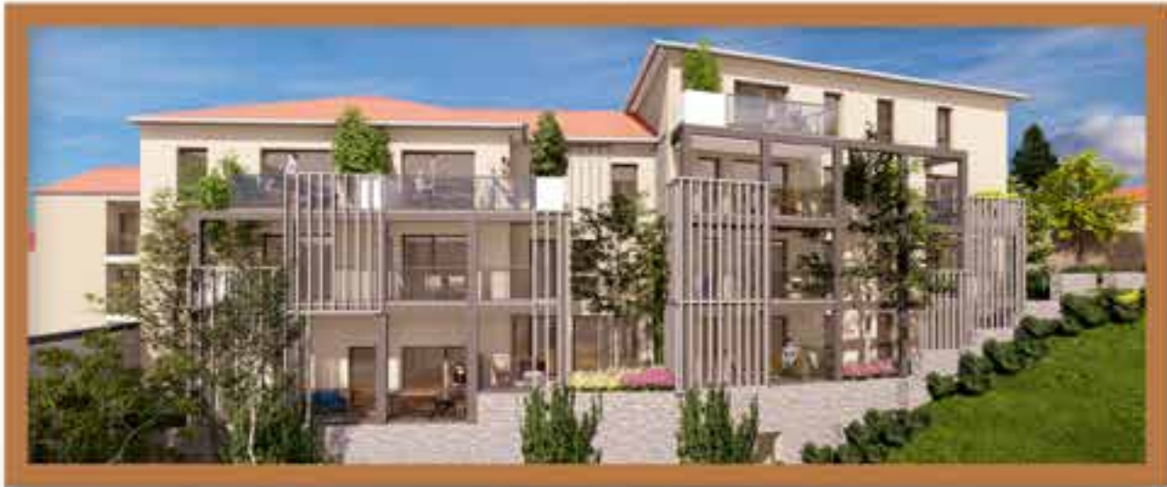
Façade de l'îlot 2.