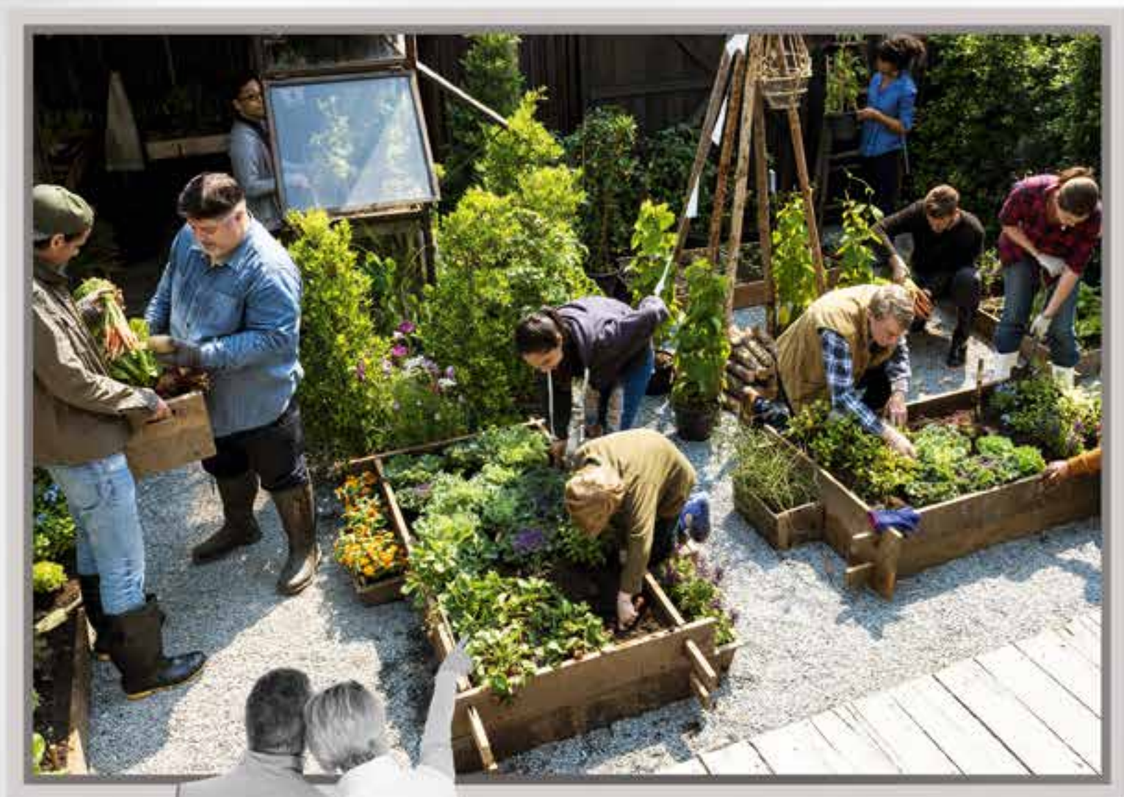
Des espaces potagers à la disposition des résidents.