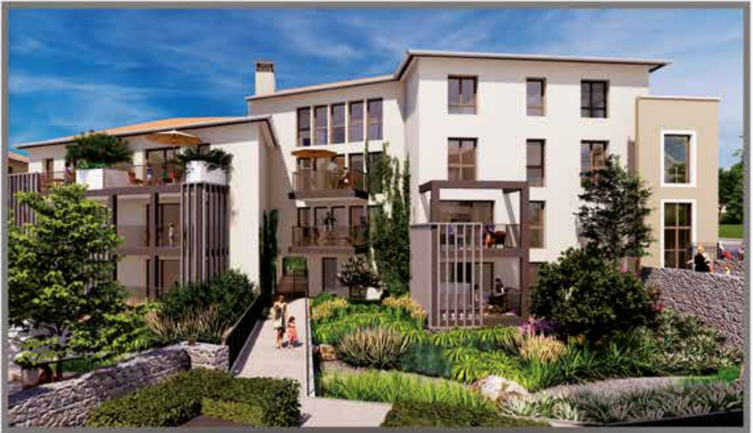
Façade de l'îlot 1 et aménagement paysager.

« L'ÎLOT BOURG-JARDIN PROPOSÉ REVÊT LE BIEN-ÊTRE ET LE CONFORT AU CŒUR DE LA CONCEPTION, EN INTÉGRANT LE VÉGÉTAL À L'ARCHITECTURE. HABITUELLEMENT RAPPORTÉ CET ÉLÉMENT DE COMPOSITION DEVIENT CENTRAL ».