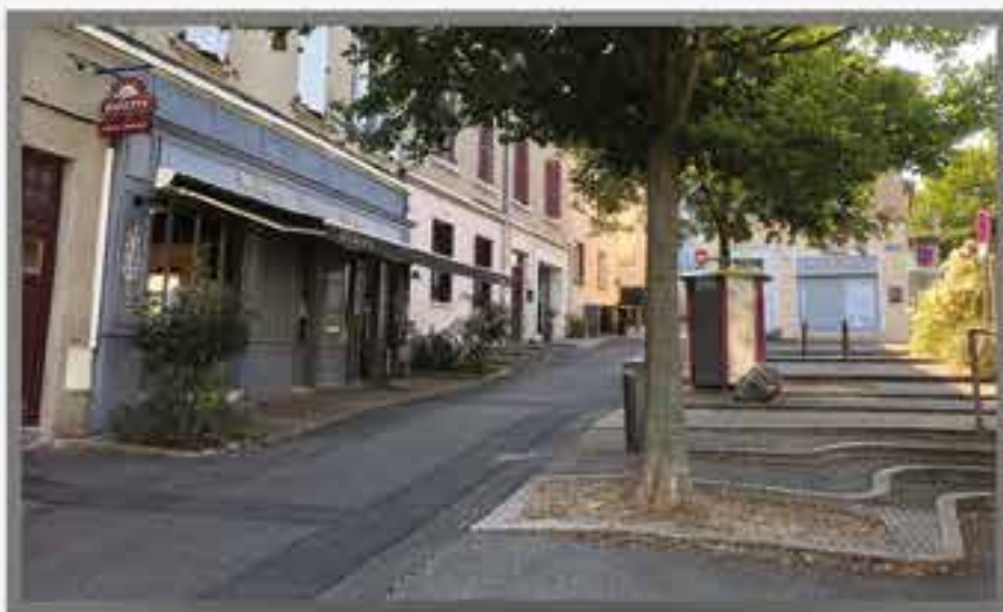
La rue de l'Église et ses commerces.

Châteaux, domaine Melchior Philibert, tours, lavoirs, église admirablement conservée, sont la promesse de balades sympathiques et de charmantes visites. Ce riche passé historique flirte avec des espaces naturels préservés et de généreux vergers : ils occupent à eux seuls près de la moitié du territoire communal ! Le passé historique, agricole et arboricole laisse aujourd'hui la place à une vie agréable et paisible au cœur de Charly. Commerces de proximité, équipements collectifs, associations débordantes d'idées : Charly se distingue par sa vitalité pour le plus grand bonheur de ses habitants. Située en zone B1, Charly est éligible au dispositif Pinel.