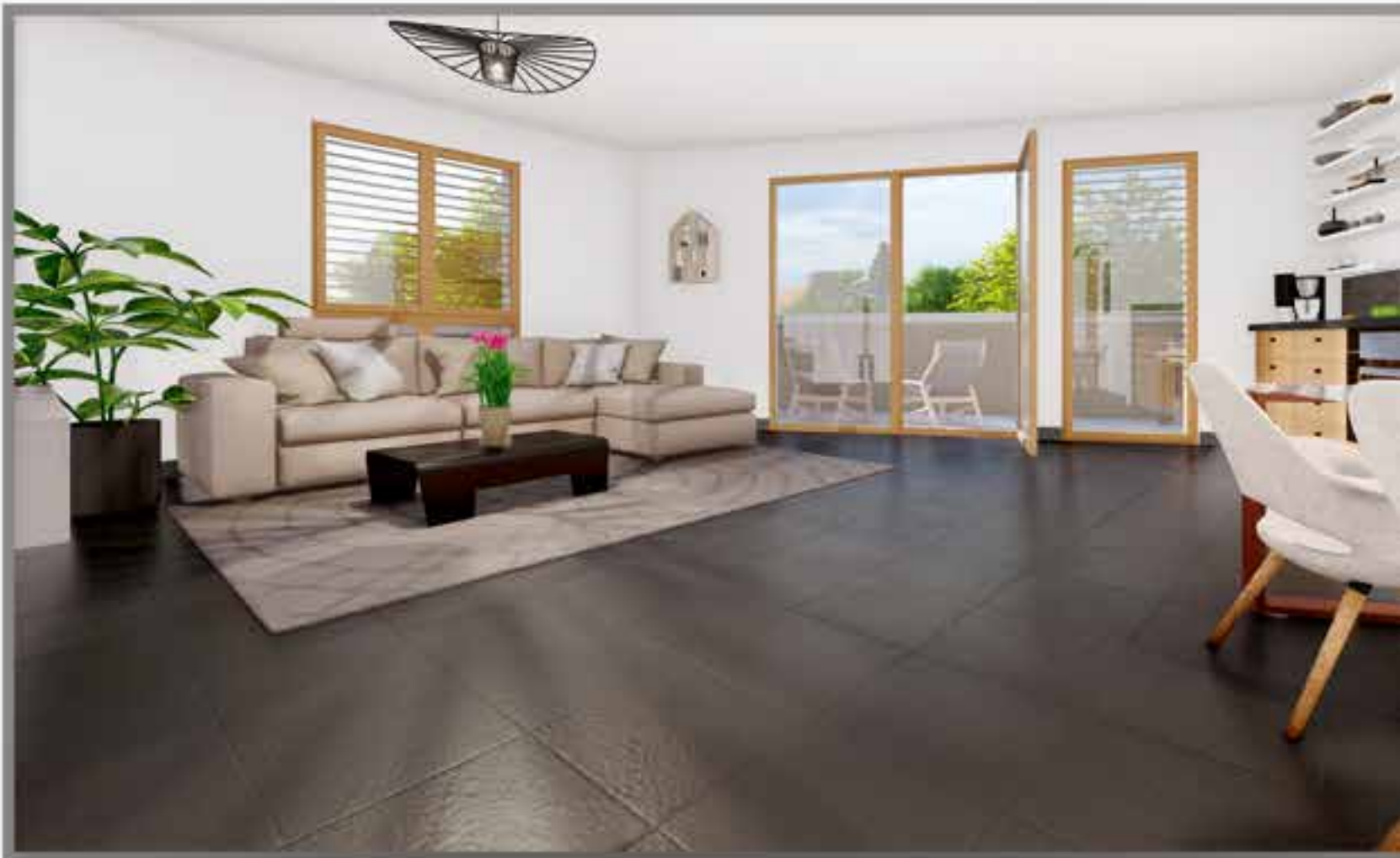
Îlot 1 - Appartement avec terrasse (côté rue Frénet).