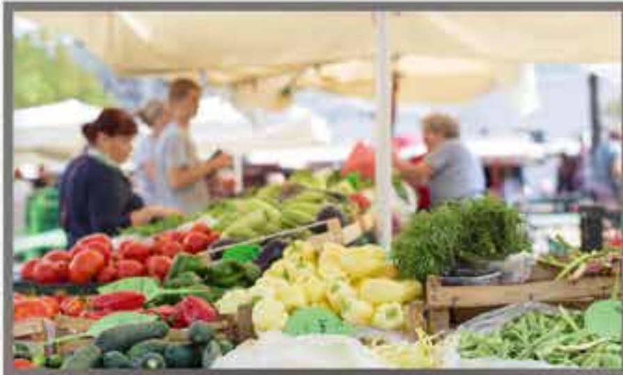
Le marché sur la place de la Mairie.