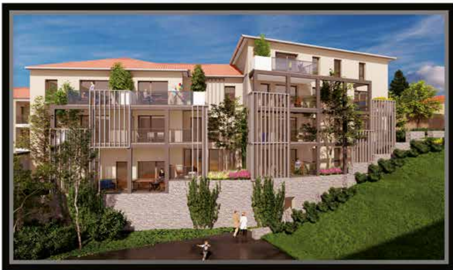
Façade de l'îlot 2.