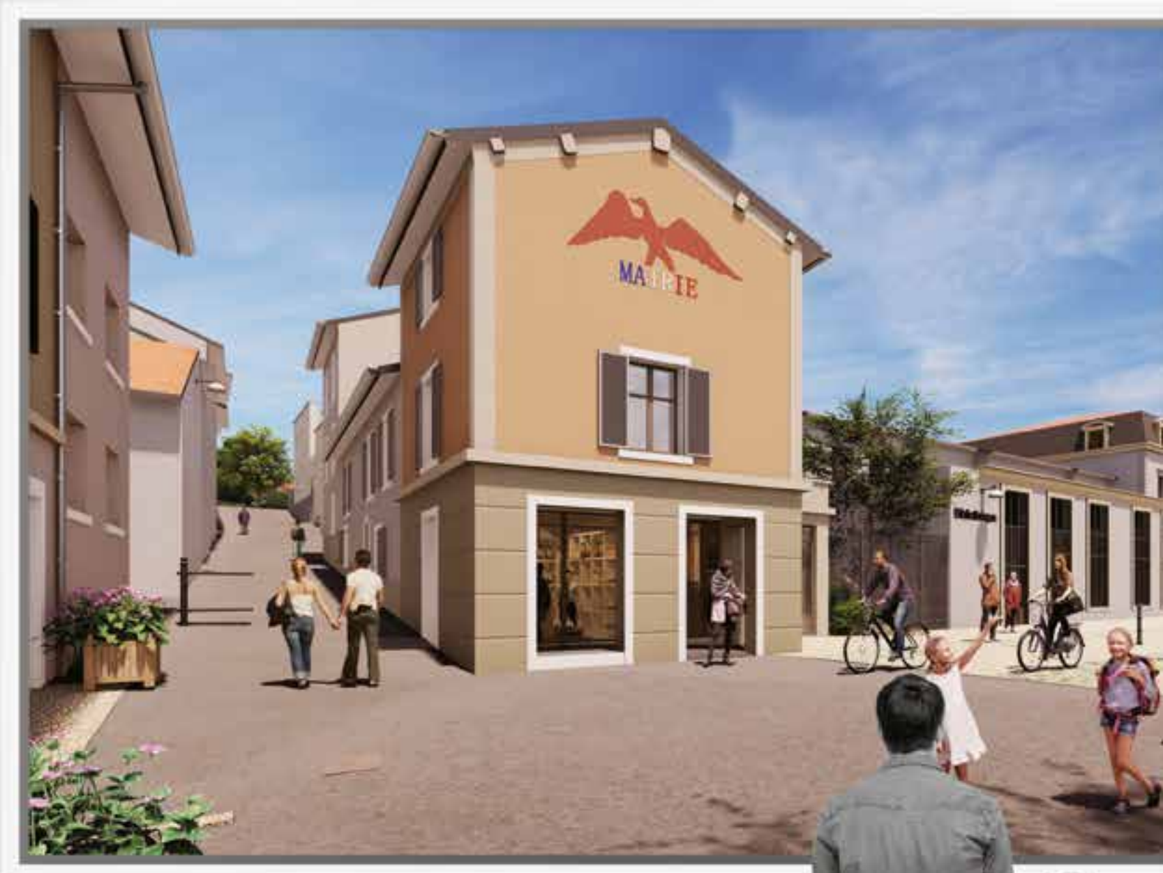
Place de la mairie, la maison à « l'Aigle Impérial » et la bibliothèque.