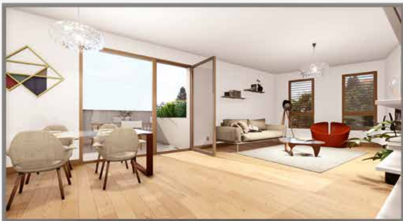
Îlot 2 - Appartement avec terrasse (côté rue de l'Église).