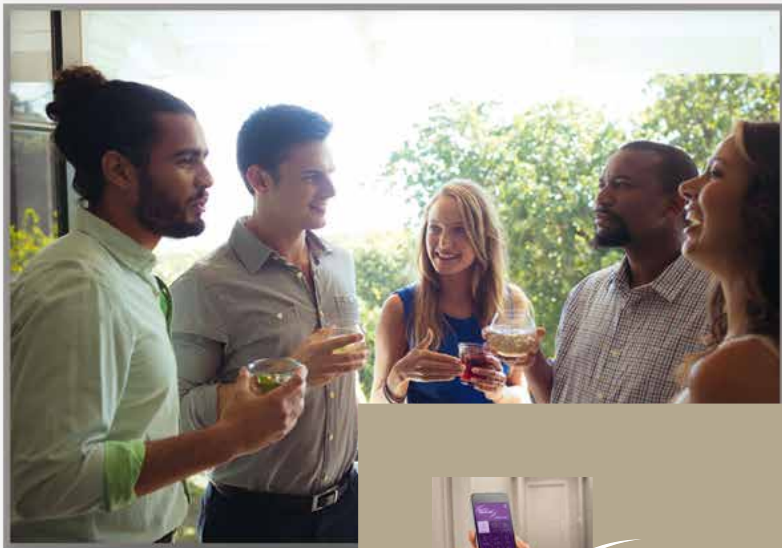
Des rencontres entre résidents initiées par l'animateur de vie résidentielle.