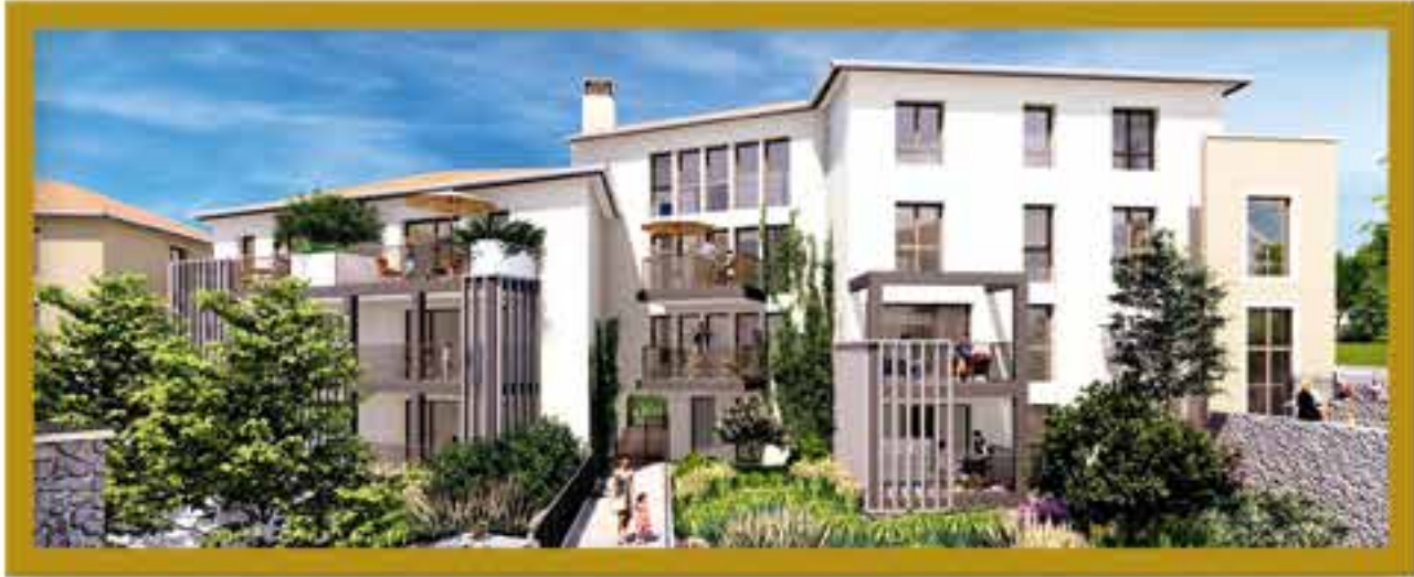
Façade de l'îlot 1 et aménagement paysager.